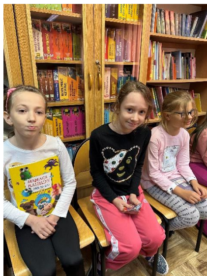
Lekcja biblioteczna w klasie 3a