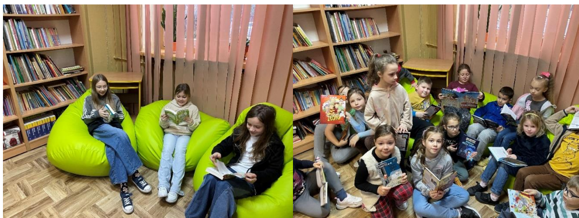
Nowe pufy dla czytelników