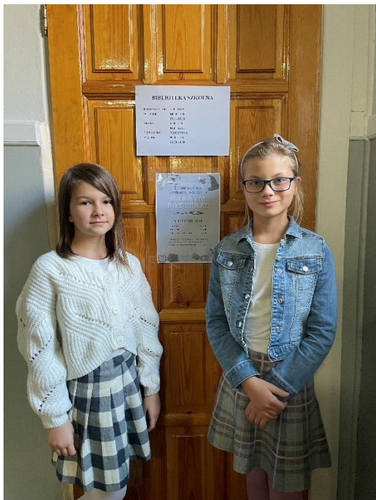
Szkolne Koło Aktywu Bibliotecznego