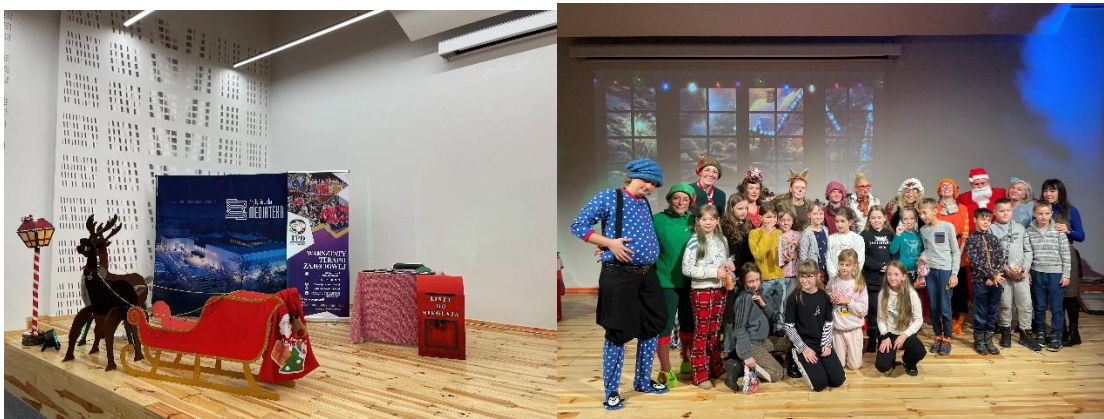
Udział klasy 3a w świątecznym przedstawieniu