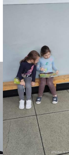
Typowa przerwa w naszej szkole 😊