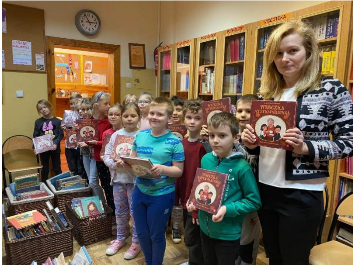
Udział klasy 1a i 1b w projekcie „Mała książka- wielki człowiek”