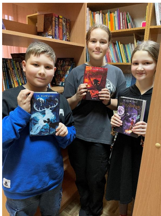
Zwycięzcy etapu szkolnego wśród nowych regałów