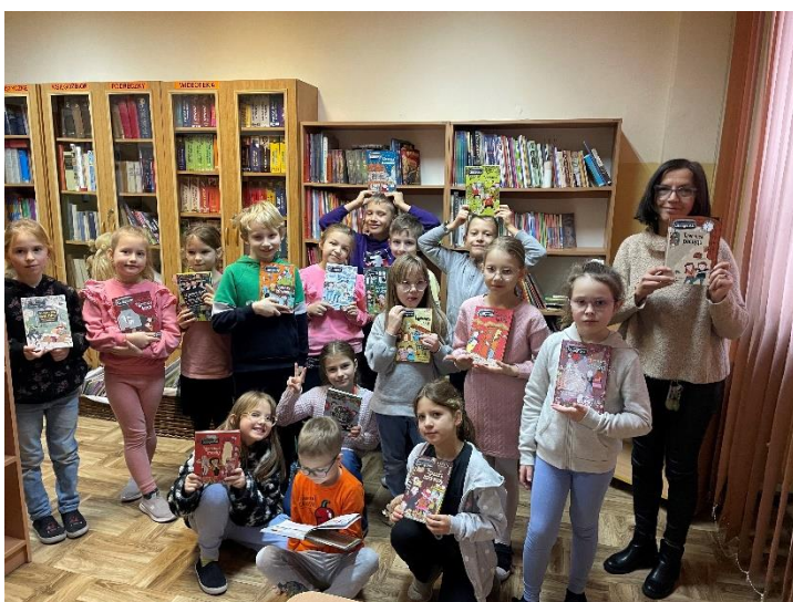
Udział klas drugich w akcji czytelniczej- „Wypożycz nowość”