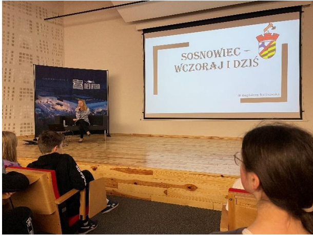
Udział klasy 7a i 8a w prelekcji „Sosnowiec- wczoraj i dziś”