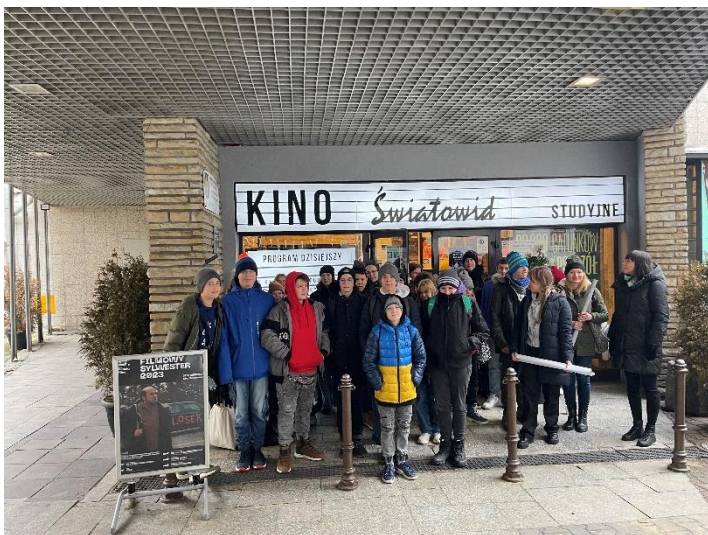
Udział klasy 7a i 8a w projekcie edukacyjnym „Od oglądania do czytania”- przygotowanie do egzaminu ósmoklasisty.

Wydarzenia organizowane przez Zagłębiowską Mediatekę