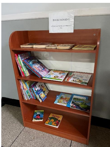
BOOKCROSSING- wymiana książek